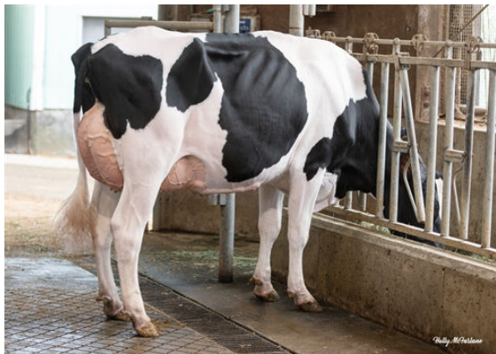
PROGENESIS MAGNIFIQUE PROUD DAM